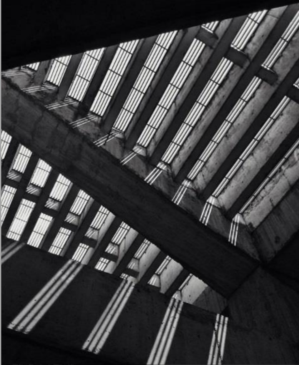
Space Oddity 2.