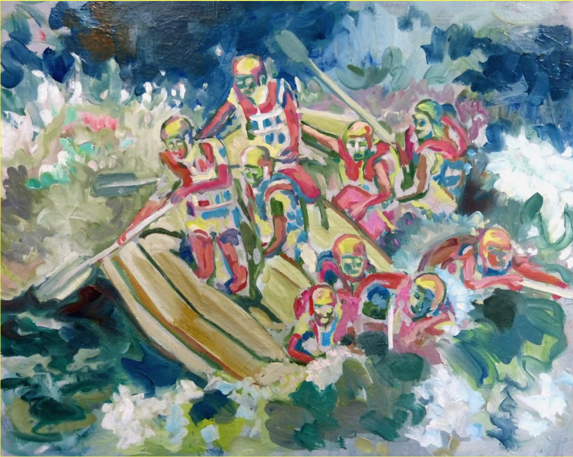
La Balsa .2017 Óleo sobre lienzo 100x 120 cm Marcela Salas