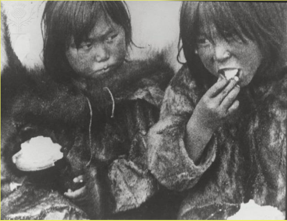
Fotograma de Nanook el Esquimal