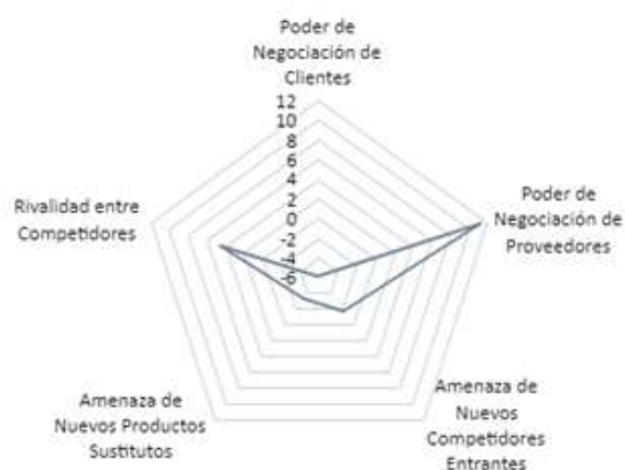
Imagen 3. Gráfico cinco fuerzas de Porter.

También se observa que el impacto económico está muy marcado pues es evidente que se han unido esfuerzos para lograr la reactivación del sector de la construcción. Esto debido a que es uno de los actores importantes para el crecimiento de la economía nacional, a pesar de factores que afectan notoriamente, como son el alza del precio del acero a nivel mundial.