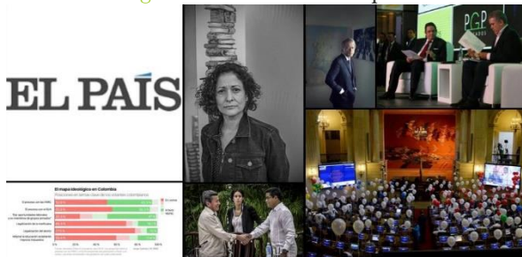
Figura 5. Planos El País.