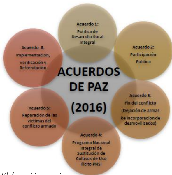
Figura 1. Los acuerdos de paz.

El informe señala que durante los primeros 100 días de mandato del presidente Iván Duque se han registrado 120 asesinatos de líderes. Por otro lado, este año han sido asesinados 92 exguerrilleros de las FARC (EL TIEMPO, 2020).