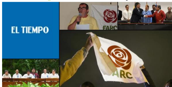
Figura 5. Planos El Tiempo.