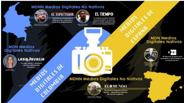
Figura 6. Entrevista a Editores: Percepciones ante el Posacuerdo.