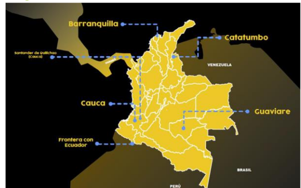
Figura 7. Escenarios de la eterna vulnerabilidad.